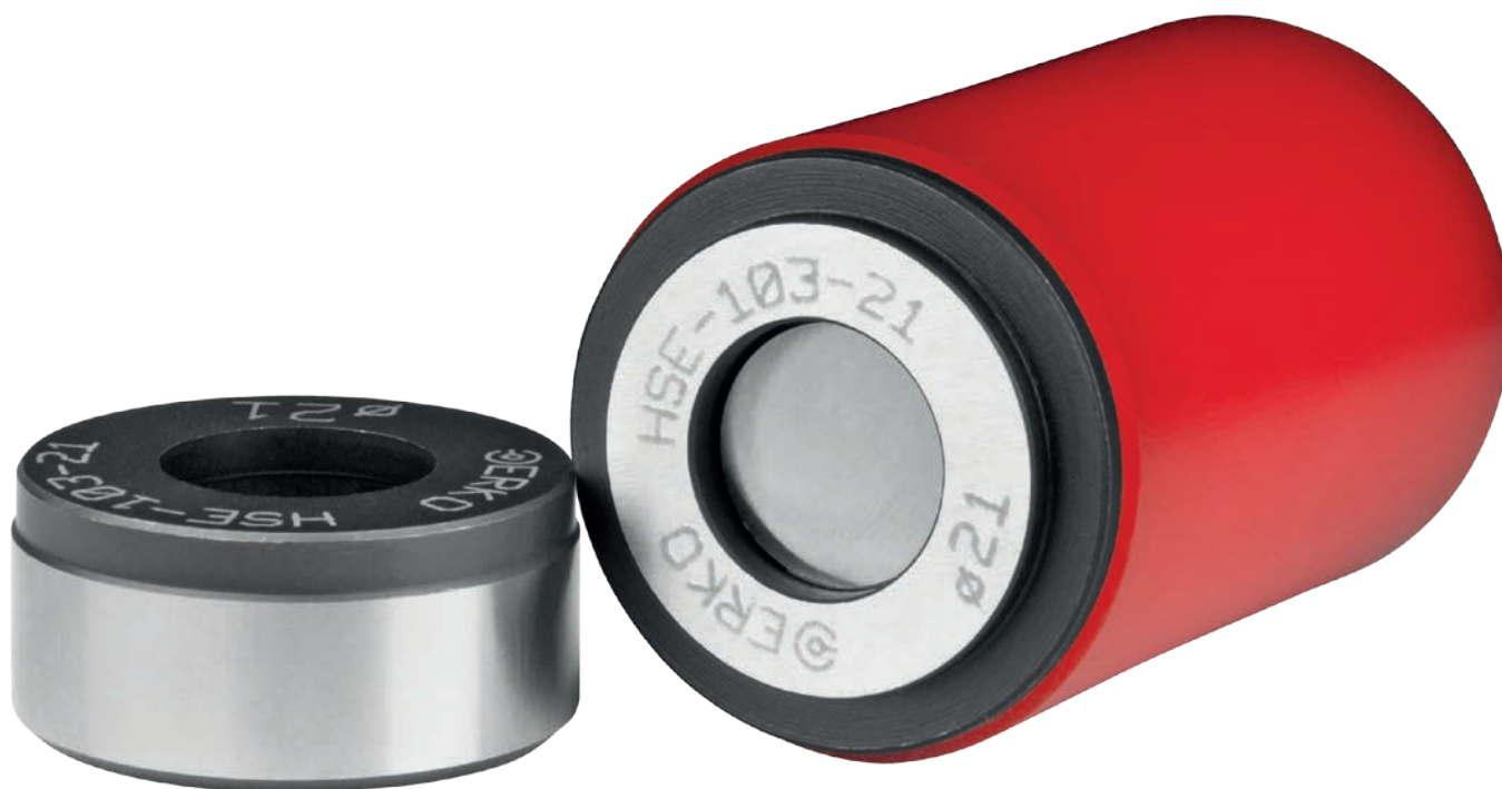
Стандартные размеры штампов